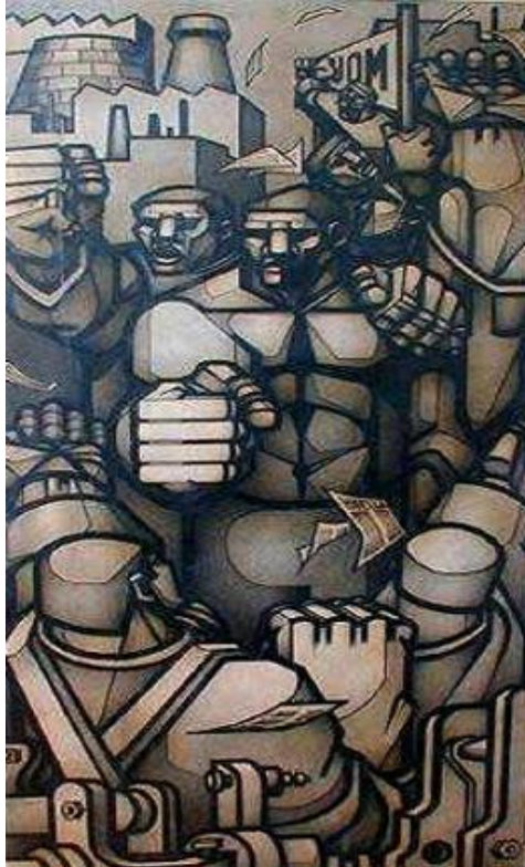
Trabajo, solidaridad y lucha. (Mural realizado para el sindicato de Alimentación 1961)

Carpani no era como laque se veía en las obras hasta ese momento. La imagen del obrero frágil, flaco, pobre y sólo, que miraba desde la ventana, como el hombre de "Sin Pan y Sin Trabajo" (1894) de Ernesto de la Cárcova, y la imagen del obrero rendido, explotado y desvalido de la posguerra no tuvieron lugar en su arte. El obrero que mostraba Carpani representaba el empoderamiento de clase, era fuerte, tenía el puño en alto y estaba dentro de un colectivo.